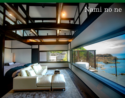
Nami no ne

Information ランプの宿 一生に一度の贅沢・露天風呂付き客室 / 聖域の岬 空中展望台・青の洞窟