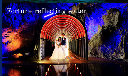
Fortune reflecting water